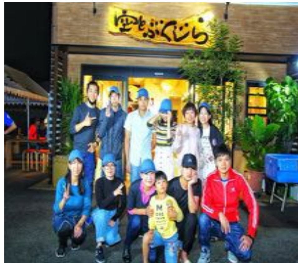
去年10月に実施したイベントのスタッフ